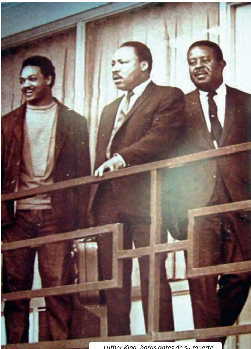
Luther King, horas antes de su muerte.

La causa de las comunidades afroamericanas estaba encaminada a conseguir la igualdad en todos los ámbitos de la vida. Para entonces eran muy pocos los negros que tenían derecho al voto. La sociedad de bienestar norteamericana se nutría del trabajo servil y mal remunerado de millones de afroamericanos, a quienes a su vez les prohibía el acceso a ella. El mo-