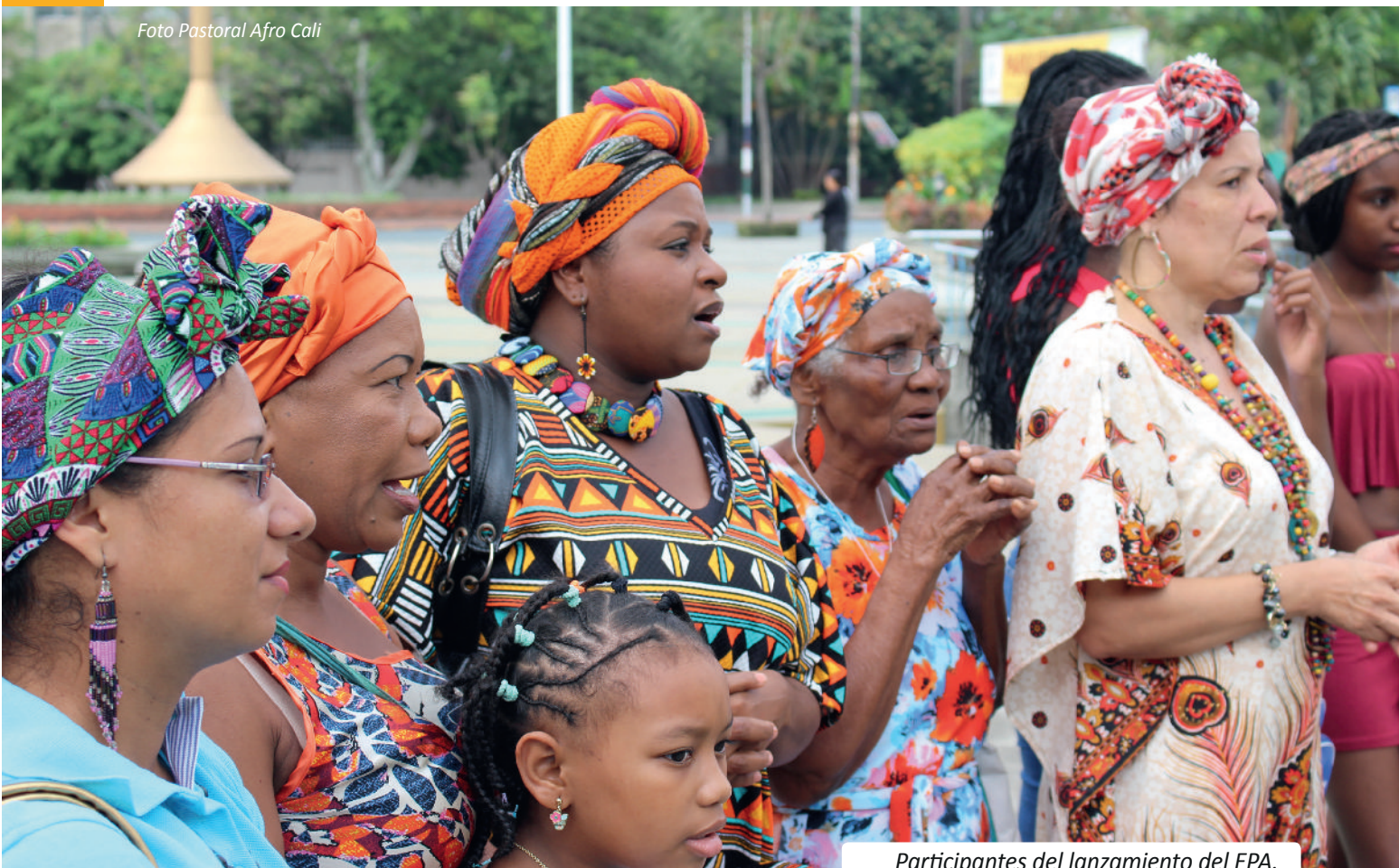
Participantes del lanzamiento del EPA.

desde el Evangelio todos somos invitados a optar por los valores del Reino. En este sentido, la espiritualidad cristiana afro permite valorar los aportes que otras espiritualidades hacen a la construcción de la casa común.