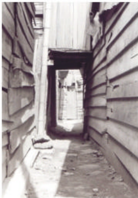
Vista desde lo alto de Sardi, Charco Azul y Villa del Lago. Callejón en Charco Azul, callejón en Sardi.