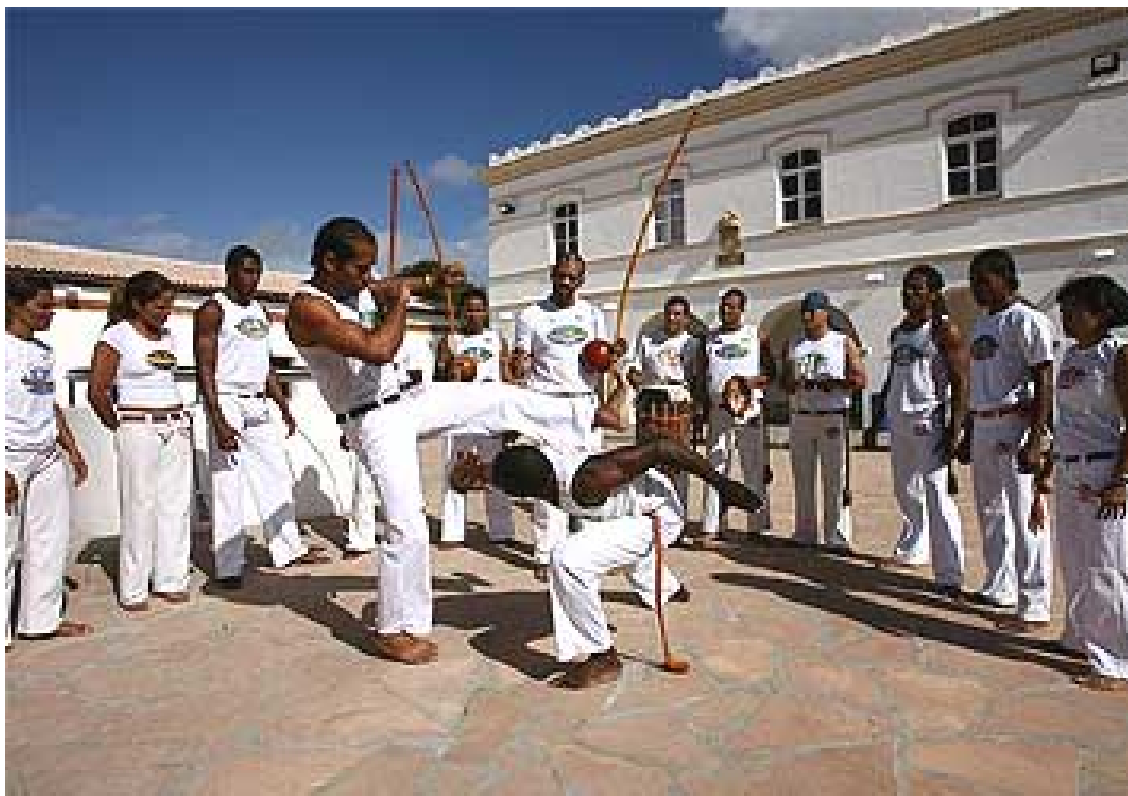
Foto Jornal A Tarde, 14/08/2007 – “A Meca dos Capoeiristas” Obs.: A foto é de uma apresentação do Grupo Abadá, citado já no 2º capítulo desta dissertação.

Vejam agora o terceiro aparelho considerado pelo professor Paulo Lima, o Ginga Mundo, que é, ao mesmo tempo, o nome de um grupo de capoeira dissidente do grupo Abadá, visto no segundo capítulo desta dissertação, e nome de um evento de caráter anual, realizado em Salvador, desde 2002, que reúne capoeiristas, estudiosos, pesquisadores, artistas e turistas de muitas partes do mundo. Esse evento é organizado pelo Mandinga, ONG, mantida pelo grupo Ginga Mundo. Vejamos um release da edição do evento de 2008, presente no site oficial da Secretaria de Turismo do Estado da Bahia