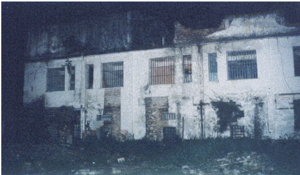
Foto do Acervo do ACC – Atividade Curricular em Comunidade intitulada Ensino e Pesquisa na Roda de Capoeira 114 , 2003 (RELATÓRIO TÉCNICO CIENTIFICO, 2003-A, anexos)

Veja, a seguir, fotos do antes e depois da referida reforma